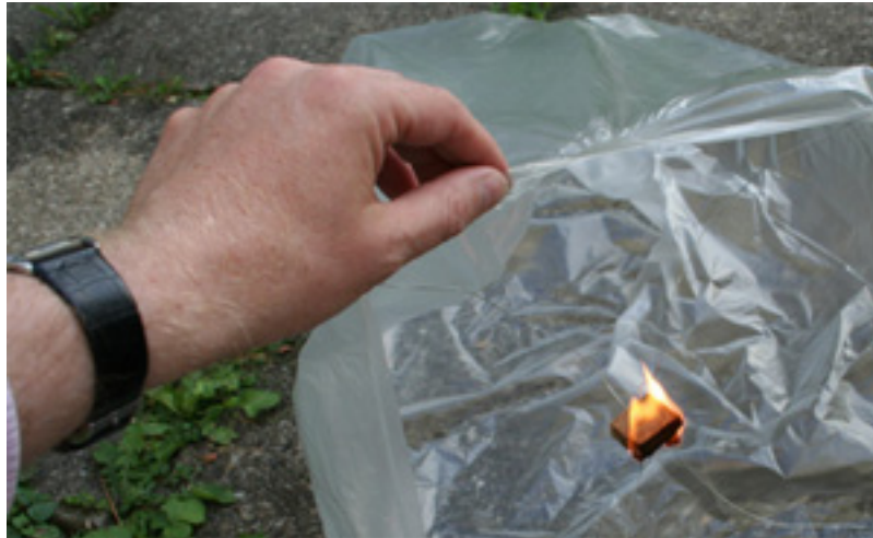
Bild 8: Auf genügend Abstand zwischen dem Anzünder und dem Beutel achten.