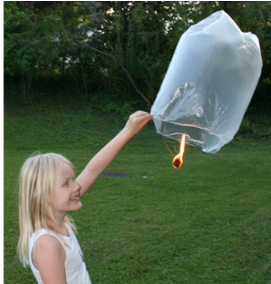
Bild 11: In Wohngegenden den Ballon mit einer Leine oder der Hand daran hindern zu hoch zu steigen.