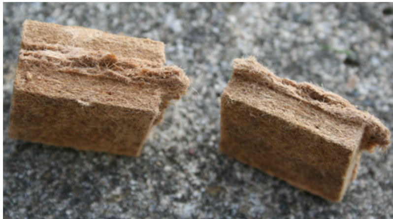
Bild 5: Einen Grillanzünder (links) in zwei Hälften aufschneiden.