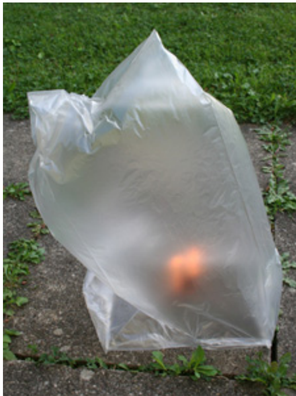
Bild 9: Der Heissluftballon wird auf einem nicht-brennbaren Untergrund aufgestellt.